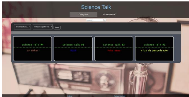
Figura 2. Página 2 do Science Talk

Foram gravados quatro programas em formato de entrevistas com professores que discutiram e apresentaram seus projetos de pesquisas desenvolvidos dentro do campus Campo Grande do IFMS. Esses programas foram editados e transformados em arquivos de áudio. Para facilitar o acesso enquanto a página ainda estava em construção, utilizamos a plataforma do YouTube para publicar os programas, que foram disponibilizados conforme a sua conclusão.